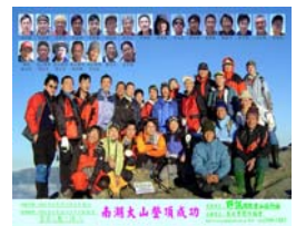
贈品：團體合影紀念照